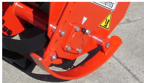
Skids depth control