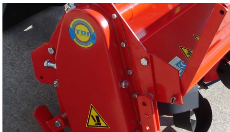
Transmission by gears